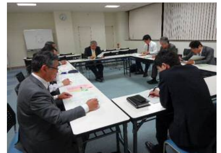
▲第1回理事会の様子

★★★★★★★★★★★★★★★★★★★★★★★★★★★★★★★★★★★★★★ 消費者被害の未然防止のために ★★★学習会をしませんか？★★★